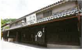
5 楠戸(くすど)家住宅