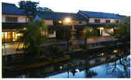
1 倉敷川畔 伝統的建造物群保存地区