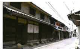
27 下津井(しもつい) 町並み保存地区