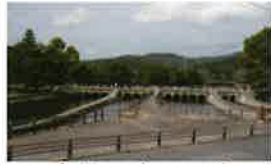
18 高梁川東西用水 取配水施設