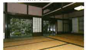
31 旧柚木(ゆのき)家住宅 (西爽亭(さいそうてい))