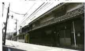
30 玉島 町並み保存地区