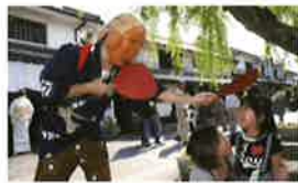
14 素隠居(すいんきょ)