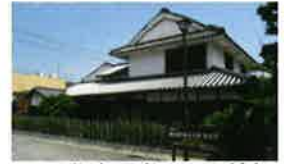
20 磯崎眠亀(いそざき みんぎ)記念館