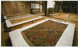
21 錦菫薙(きんかんえん)