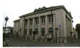
7 旧中国銀行 倉敷本町出張所