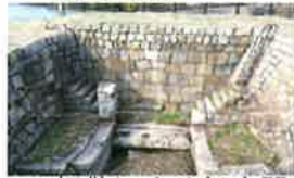
22 板敷(いたじき)水門