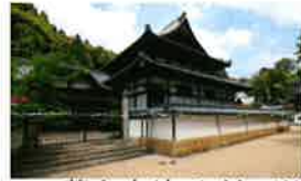
23 蓮台寺(れんだいじ)