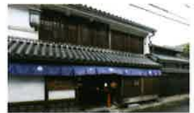
28 むかし下津井 回船問屋