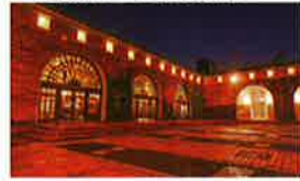
11 倉敷アイビースクエア