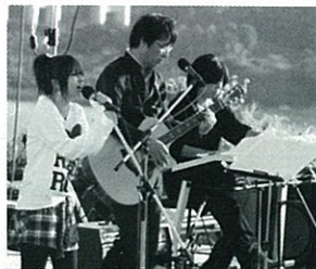
HAB -稗田アコースティックバンド-