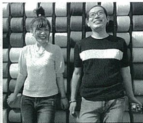
Yoshimi with sp