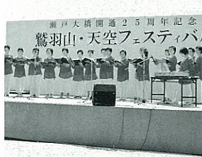
女性合唱の会アンダンテ