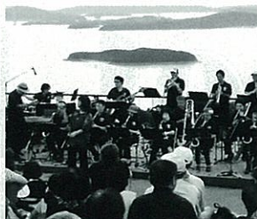
GROVE UNITY JAZZ ORCHESTRA