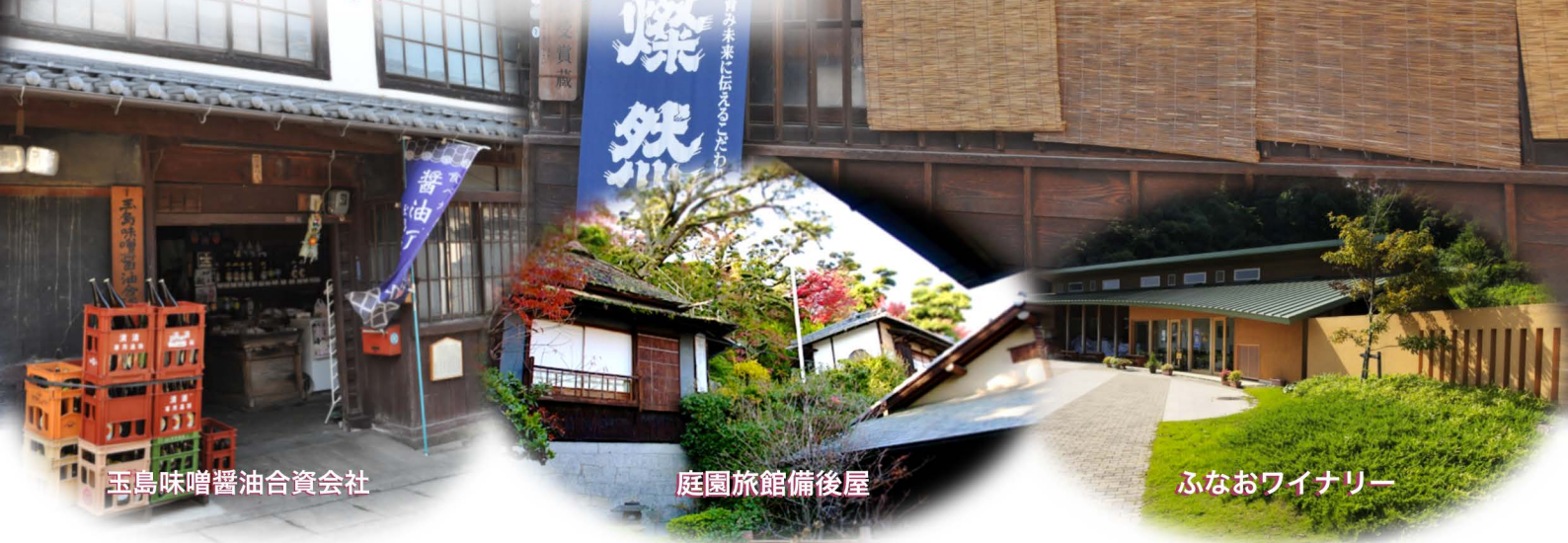
玉島味噌醤油合資会社